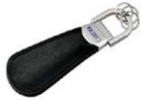
RISOシューホーンキーホルダー

ご来場の記念に下記の中からご希望の品をおひとつプレゼントいたします。 下記の「 ご来場予約申込書 」に必要事項をご記入のうえ、FAXにてご返信ください。