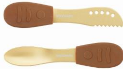
RGアイスクリームスプーン & パターナイフ