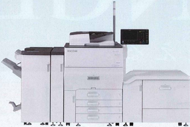
RICOH Pro C5110s / C5100s